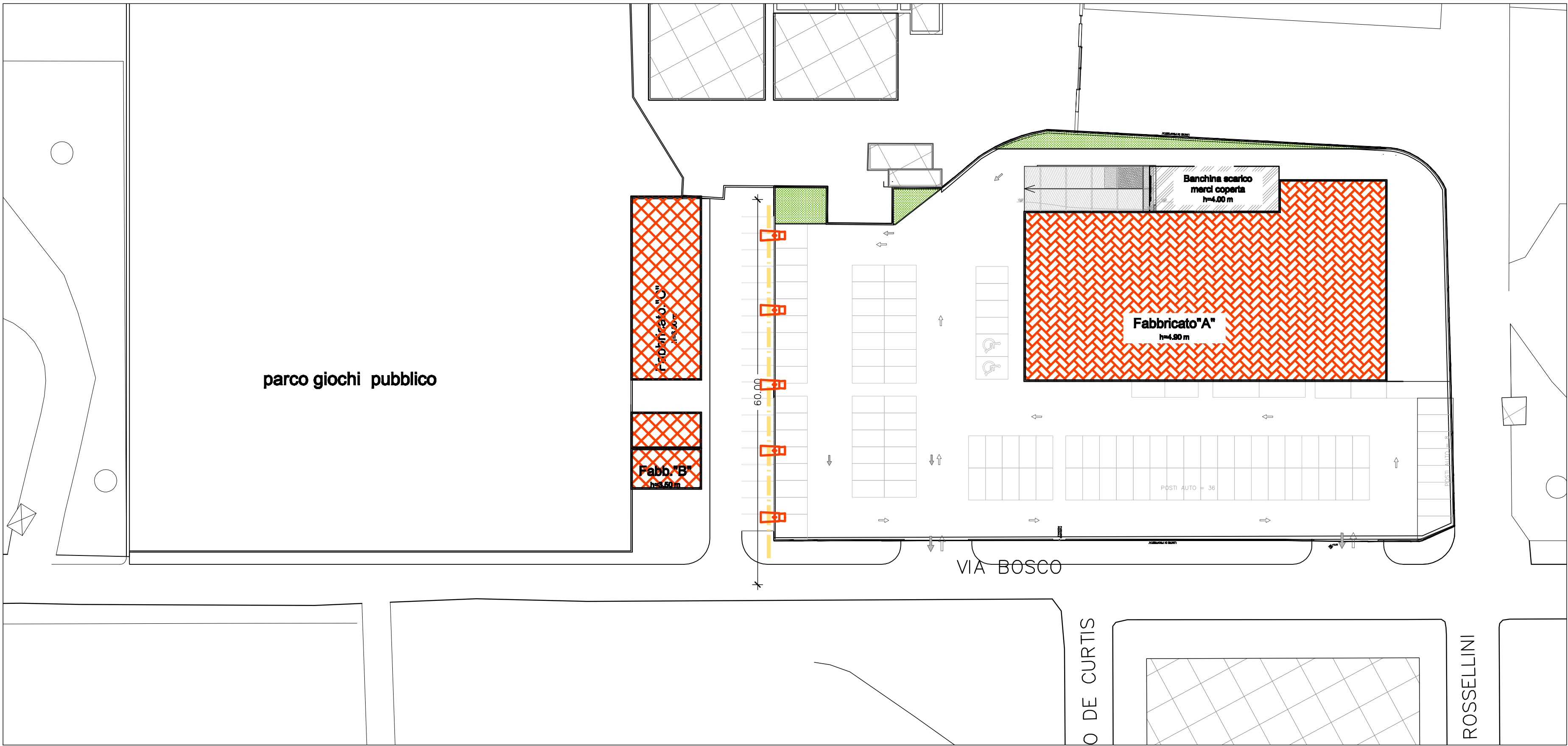
SCHEMA OPERE DI URBANIZZAZIONE PRIMARIA VIA BOSCO RETE ILLUMINAZIONE PUBBLICA — scala 1:500

Ing. Claudio Franco — via Leverano, 7 — Veglie (LE) 0832 968826 cell. 3939584531— email:claudiofranco@libero.it — P.I. 02197631209 — C.F. FRNCLD68H13L711G